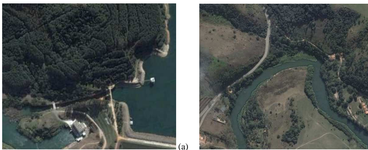
Figura 3. Imagem representativa de ponto aleatório pertencente à classe alta (a) e classe muito alta (b) inserido no Google Earth .

Na Figura 3a pode ser observada uma área que foi associada à classe alta, a qual corresponde a uma APP com plantios de Eucalyptus spp. A imagem foi adquirida através de um ponto aleatório da classe que foi inserido no Google Earth , como mencionado no desenvolvimento do trabalho. Esta prática é muito polêmica e muitos estudos vêm sendo ainda realizados a fim de demonstrar se realmente esta espécie pode influenciar o comportamento dos cursos d'água por sua rápida absorção de água em função do seu crescimento acelerado. Ainda foram associadas à classe média práticas de agropecuária que se encontravam dentro de APPs. Com relação às classes altas, um ponto também é apresentado e este corresponde à pastagem dentro de APP, deixando os cursos d'água expostos (Figura 3b).